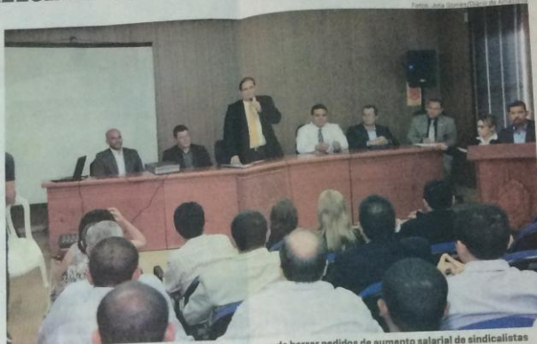
Vice-governador destacou que não há intenção do governo de barrar pedidos de aumento salarial de sindicalistas

passa por dificuldades econômicas e vários Estados estão realizando reformas administrativas, segundo secretário.