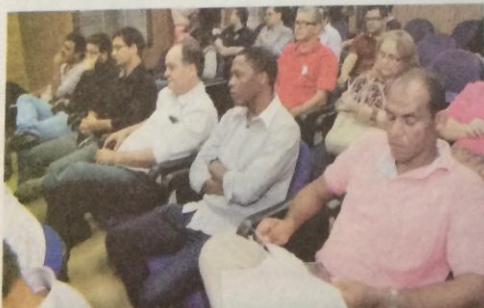
Segundo sindicatos, reivindicações estão marcadas para os próximos dias 18, 19 e 20