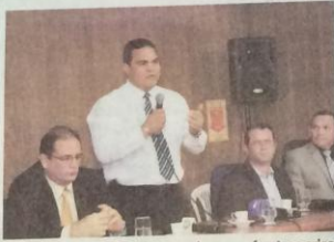
Secretário diz que é preciso cautela para enfrentar a crise