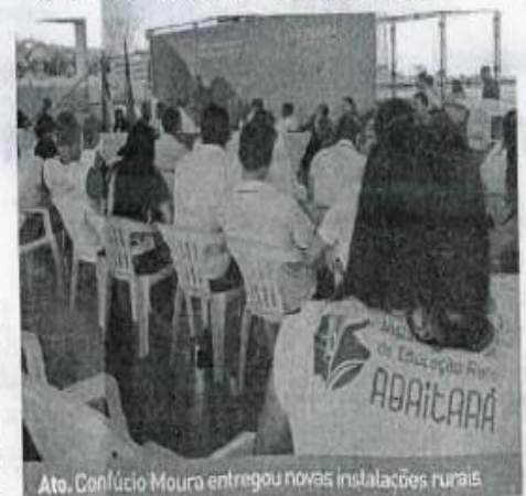
Ato. Confúcio Moura entregou novas instalações rurais