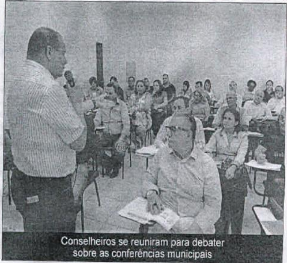
Conselheiros se reuniram para debater sobre as conferências municipais

Na reunião, que se encerra nesta quinta-feira (18), a gerente de Desenvolvimento e Políticas Públicas da Secretaria