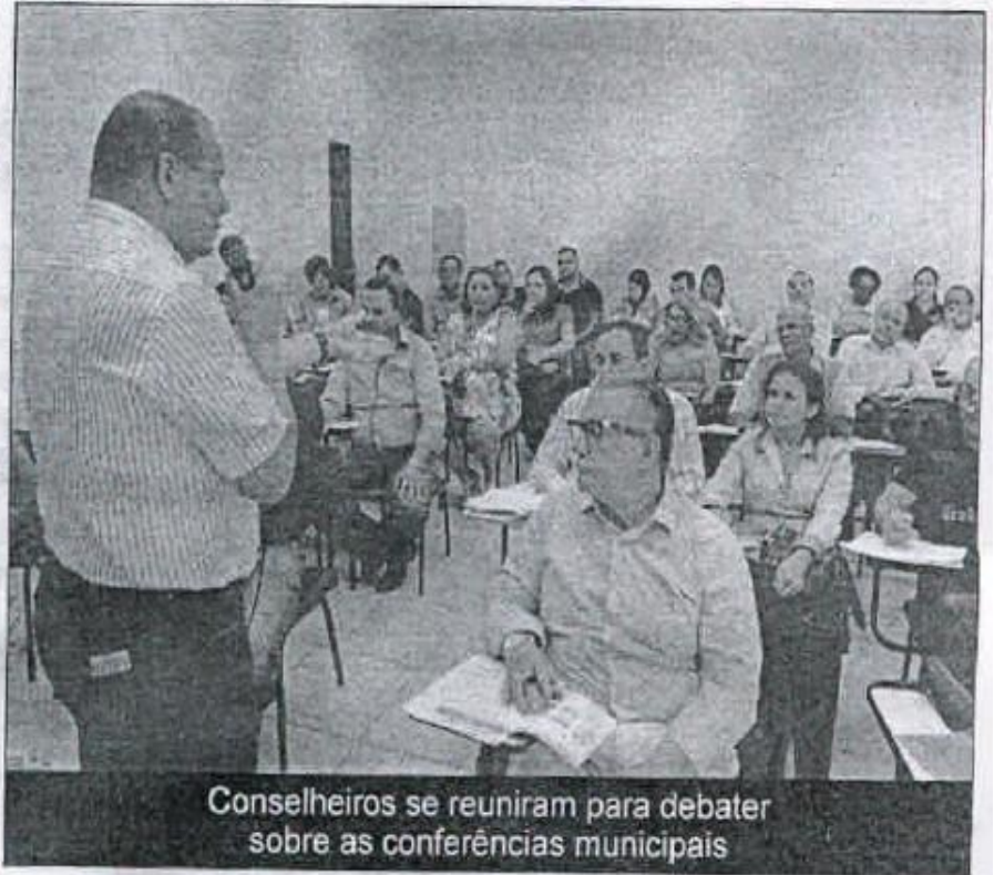
Conselheiros se reuniram para debater sobre as conferências municipais