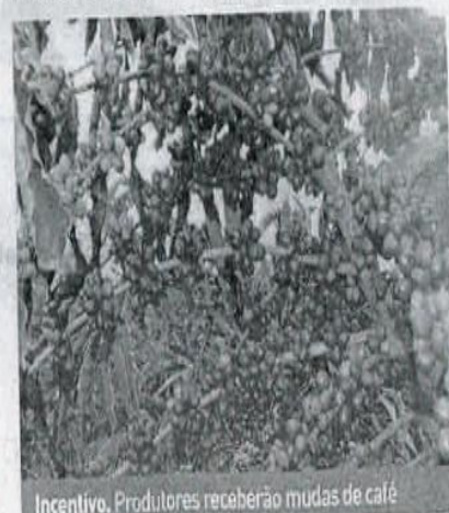
Incentivo. Produtores receberão mudas de café

der a representatividade econômica do grão para o estado e para as famílias que vivem desta cultura", destacou Nádia.