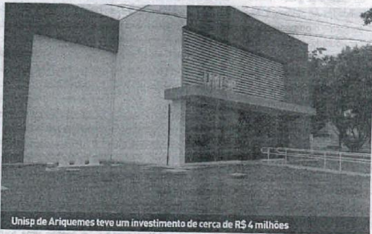
Unisp de Ariquemes teve um investimento de cerca de R$ 4 milhões